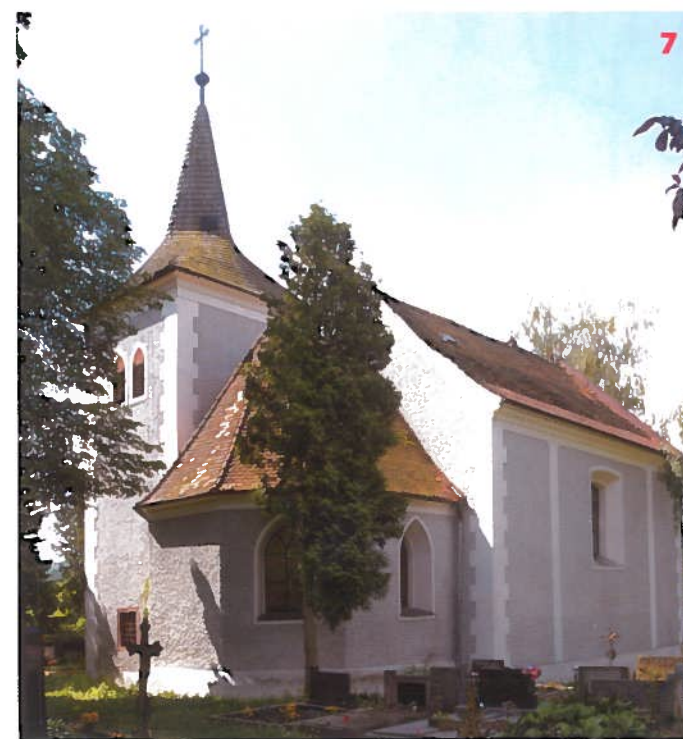
Kostel sv. Václava ve Vlachovicích