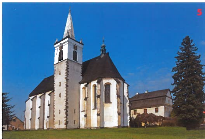
Kostel Narození Panny Marie v Milčicích