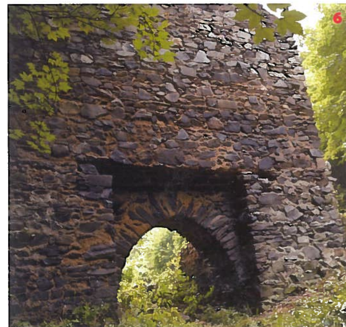
Brána městečka Odranec pod zříceninou hradu Stará Dubá