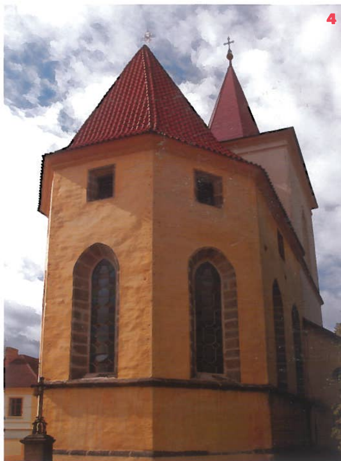
Kostel sv. Vojtěcha v Jilově u Prahy