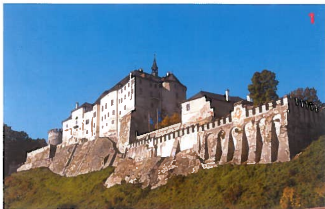
Hrad Český Sternberk