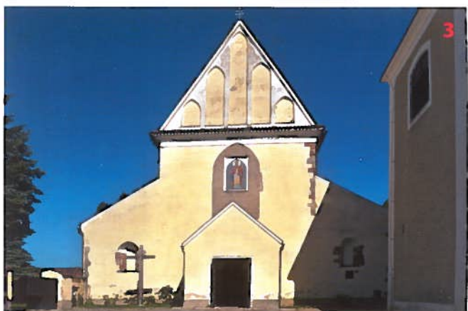
Kostel sv. Mikuláše v Dencově