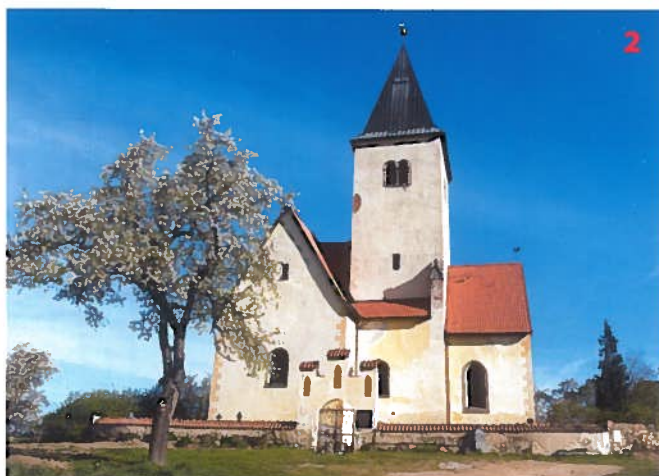
Kostel sv. Filipa a Jakuba na Chvojci