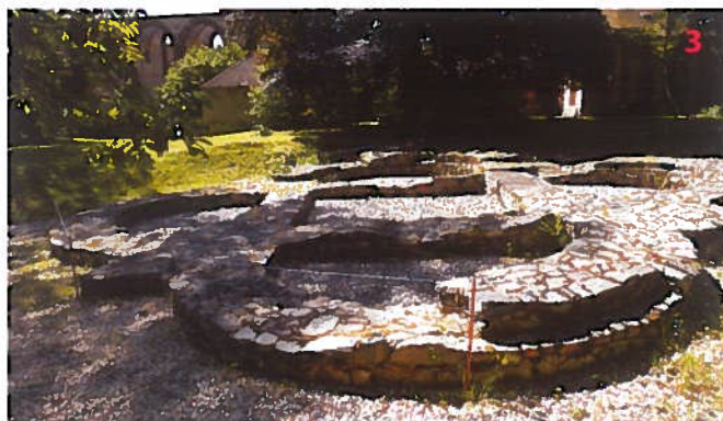
Základy kostela sv. Jitky v Sázavě