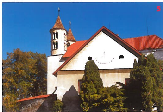
Kostel sv. Bartoloměje v Koudrčici