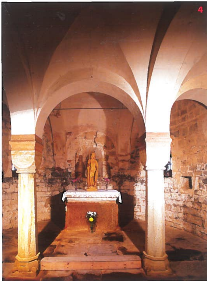
Krypta kostela sv. David v Poříčí nad Sázavou