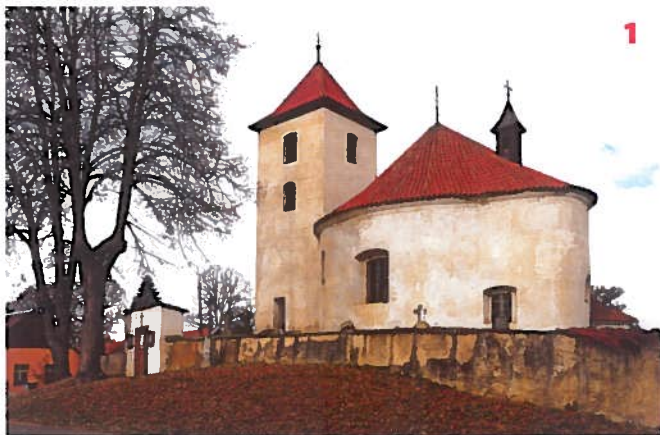
Kostel sv. Václava v Libouňi