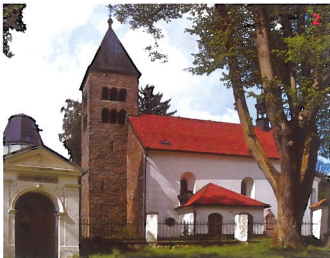
Kostel Navštívení Panny Marie v Koutné Hoře