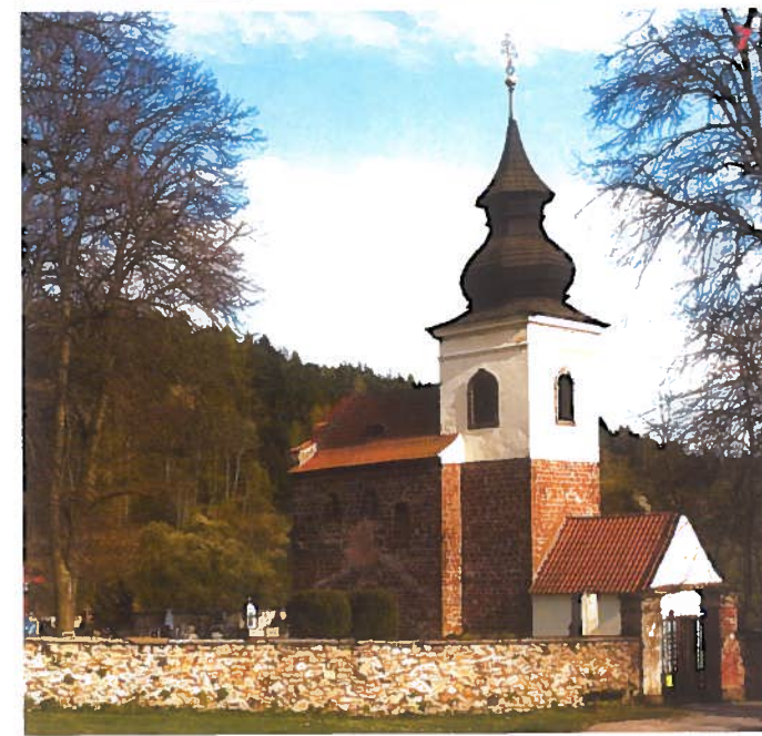
Kostel sv. Jakuba ve Stříbrné Skalici