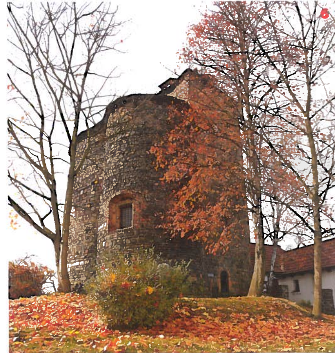
Rotunda sv. Václava v areálu hradu v Týnci nad Sázavou