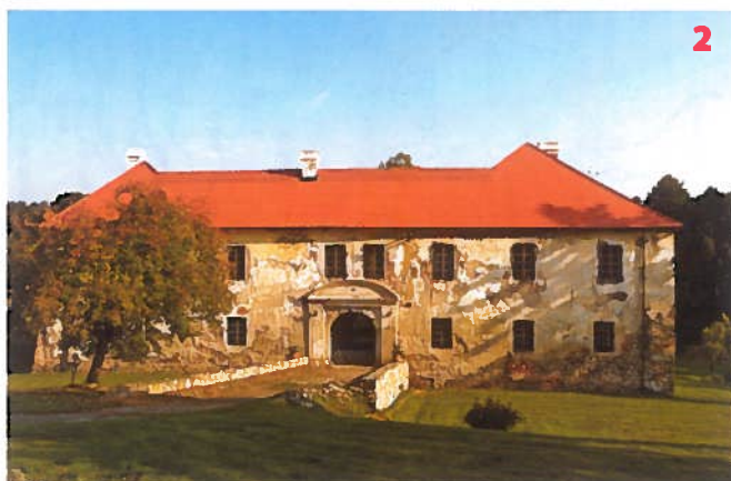
Tvrz v Jeništi