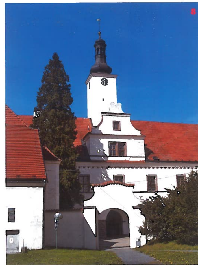
Zámek Komorní Hrádek