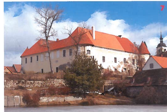
Zámek v Louňovicích pod Blánkem