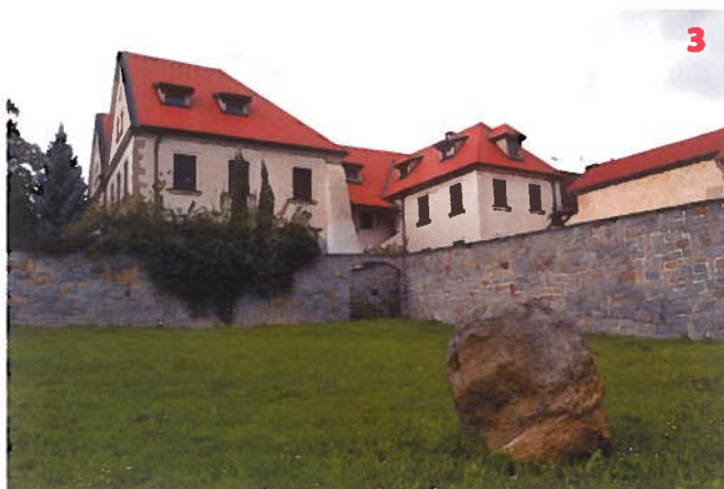
Dům Mince v Blatné u Prahy