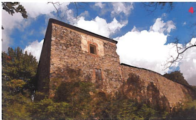
Tvrz v Vlnči