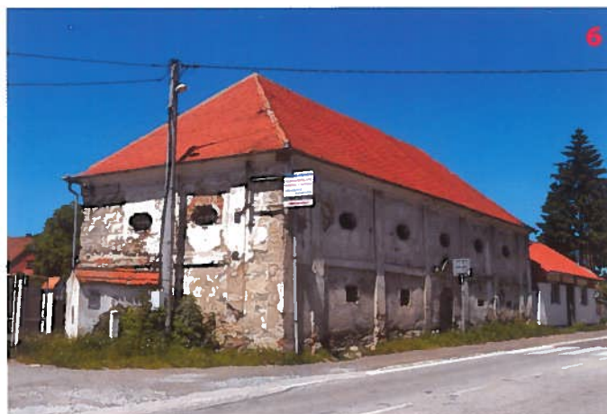
Spýchar v Olbarnovicích Vsi