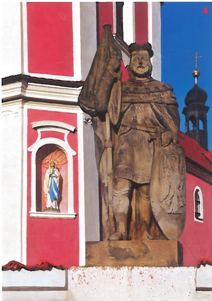
Socha sv. Václava u kostela sv. Matouše na Hradkě