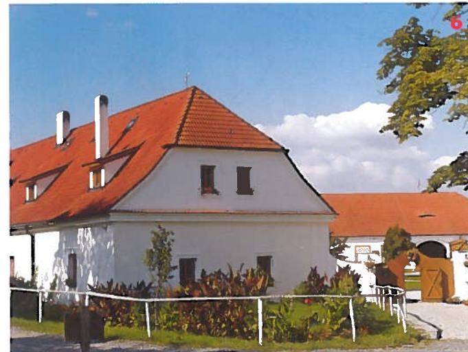
Statek v Benicích