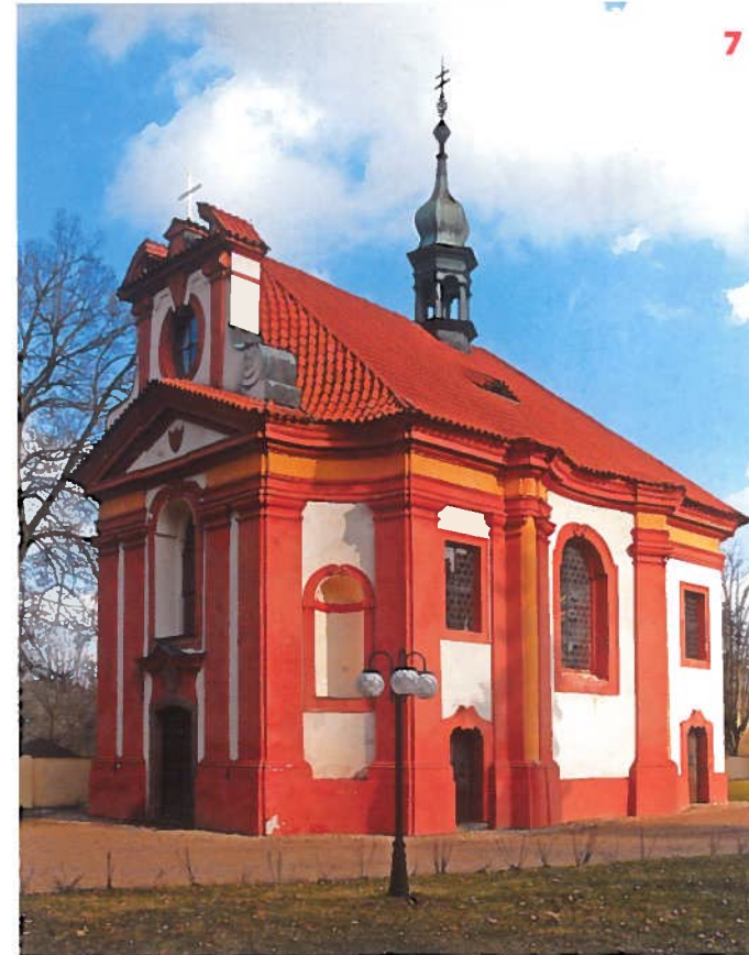
Kaple sv. Jana Nepomuckého v areálu zámku v Odlochovicích