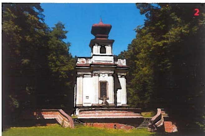
Loreta u Mlasy