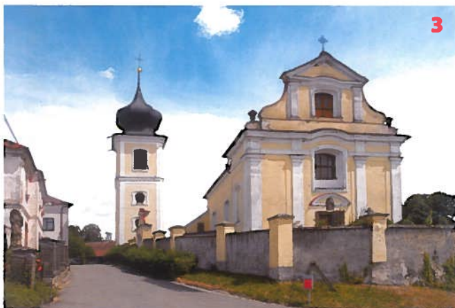
Kostel sv. Václava v Okrouhlicích